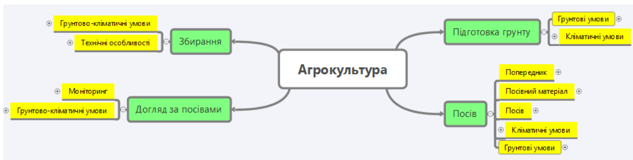
Рис. 1. Основний алгоритм забезпечення умов росту та розвитку сільськогосподарської культури.

Для розробки керованого процесу необхідно побудувати логічну схему. На рис. 1 представлений основний алгоритм розробки схеми вирощування сільськогосподарської культури, який враховує основні періоди та об'єднані групи факторів, що впливають на ріст та розвиток рослин.