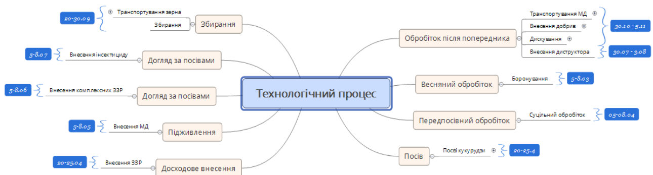
Рис. 5. Алгоритм технологічного процесу забезпечення оптимальних умов для росту та розвитку рослин.

ремої технологічної операції. При вирощуванні сільськогосподарських культур необхідно використовувати алгоритм планування техніки. Даний алгоритм заснований на принципах забезпечення потреб рослин на кожній окремій фазі росту і розвитку в оптимальний час. Сучасна система використання техніки в агроформуваннях змушує виробників використовувати найману техніку. Це стосується як дрібних агровиробників, так і великих агрохолдингів. Використання запропонованого алгоритму (рис. 5) забезпечує ефективне використання техніки. Знаючи потреби культури, сорту чи гібриду, який вирощується у господарстві, використовуючи програмне забезпечення EOS Grop Monitoring Tool , Meteo.Farm , Farmwave , Agro Measure Map Pro , Sentinel Playground , EO Browser складається робочий алгоритм, що враховує всі періоди розвитку рослин, в які необхідне втручання людини з метою забезпечення оптимальні умови для рослини.